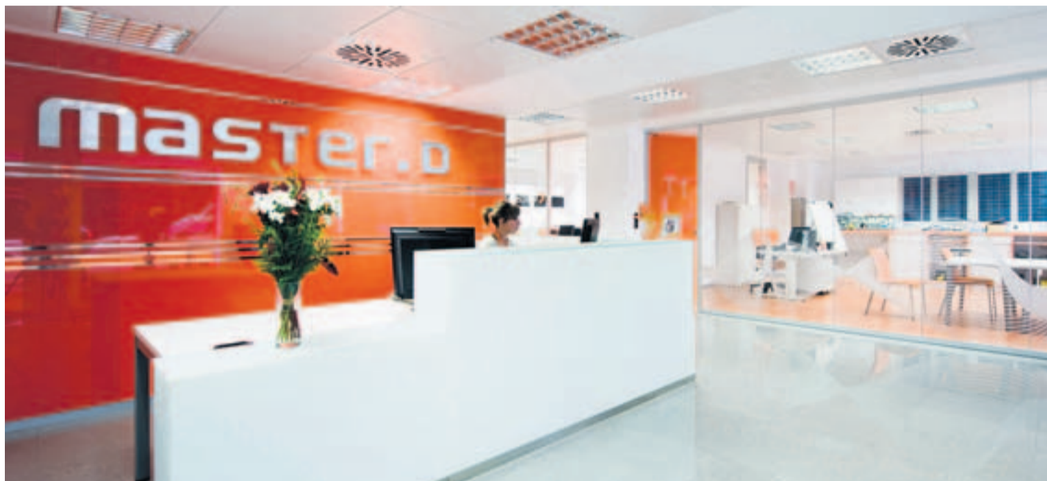
Este centro da a las personas la oportunidad de cambiar sus vidas.

La clave del éxito de la compañía está en la excelente atención brindada en su medio centenar de dele-