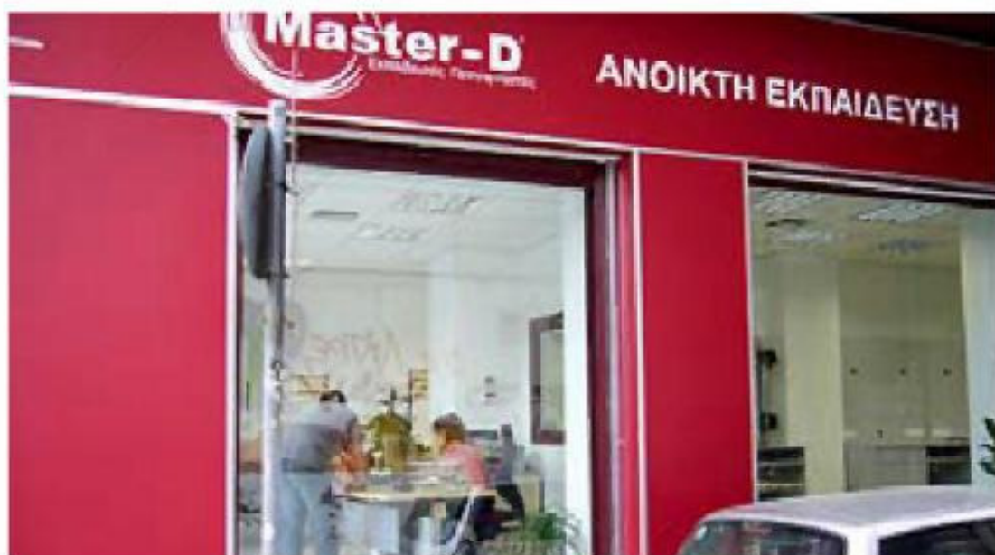
Una de las oficinas de formación que Master-D tiene en Grecia.

Con este plan de internacionalización “ponemos el acento fuera” y con él se espera obtener beneficios que repercutan en la acti-